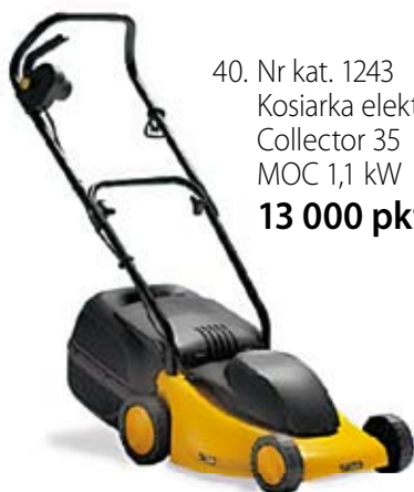
40. Nr kat. 1243 Kosiarka elektryczna Collector 35 MOC 1,1 kW 13 000 pkt.