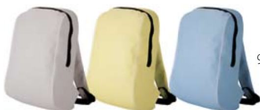
9. Nr kat. 1235 Plecak 1 147 pkt.