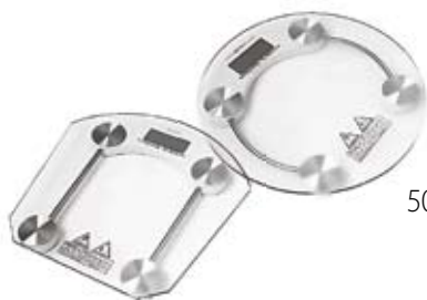
50. Nr kat. 1250 Waga łazienkowa 2 000 pkt.