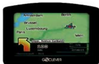
7. Nr kat. 1205 Nawigacja samochodowa GoClever 4330A MapaMap 5 (PL) 19 000 pkt.