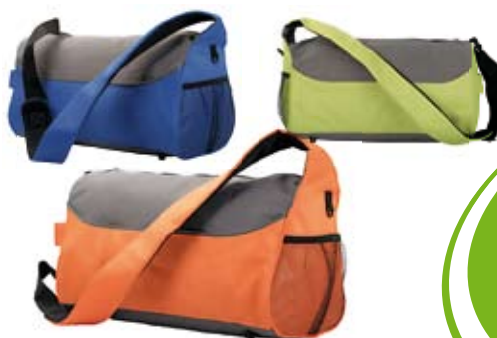
11. Nr kat. 1217 Torba 1 567 pkt.