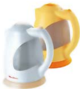
57. Nr kat. 1257 Czajnik elektryczny Moulinex BAB1L1 4 650 pkt.