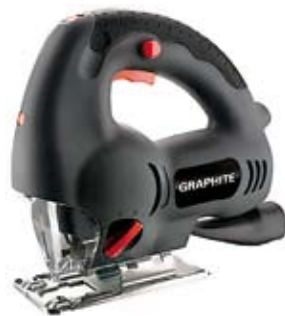
36. Nr kat. 1228 Wyrzynarka Graphite 58G071 6 100 pkt.