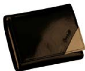
Nr kat. 1211c 3 172 pkt.