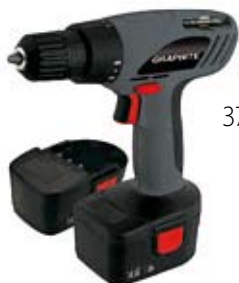
37. Nr kat. 1227 Wkrętarka akumulatorowa Graphite 14,4V 9 650 pkt.