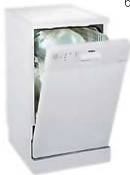
67. Nr kat. 1268 Zmywarka Amica ZWA 6414 57 500 pkt.

4 programy, temperatury zmyw. 35°C/50°C/65°C, 10 kpl. naczyń, klasy AAA, Hot Air Drying, Aqua Spray, elektroniczny wskaźnik braku soli i nabyłyszczacza, automatyka twardości wody, regulacja wysokości górnego kosza,