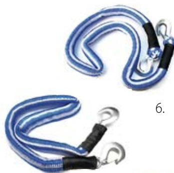
6. Nr kat. 1204 Linka holownicza 3 000 pkt.