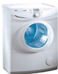
71. Nr kat. 1272 Amica AWCE12DA 56 000 pkt.

Dane techniczne Pojemność: 5.5 kg Prędkość wirowania: 1200 obr./min Zużycie wody: 49.5 l Zużycie energii: 0.93 kWh Ilość programów prania: 15 programów Klasa energetyczna A plus Klasa skuteczności prania A Wysokość: 850 mm Szerokość: 596 mm Głębokość: 505 mm Kolor: Biały z aluminiowym oknem