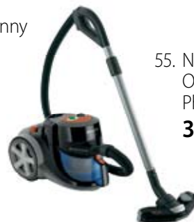
55. Nr kat. 1255 Odkurzacz bezrowkowy Philips FC 36 500 pkt.

Funkcje siekanie, mieszanie, rozdrabnianie, ucie- ranie, zagniatanie ciasta, miksowanie, ubijanie, krojenie w plastry, wyciskanie soku, możliwość jednoczesnej pracy blendera i malak- sery, pojemność malaksera 1,5L, po- jemność blendera 1L, 3 prędkości + funkcja „PULSE”, praktyczne schowki na akcesoria Wposażenie przystawka wirująca do soku, 5 tarcz ze stali nierdzewnej