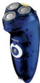
48. Nr kat. 1248 Maszynka do golenia Philips HQ6710 2 500 pkt.