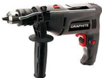
35. Nr kat. 1238 Graphite 750W 7 000 pkt.