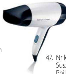
47. Nr kat. 1246 Suszarka do włosów Philips 4960 2 500 pkt.