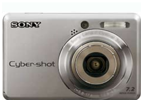
19. Nr kat. 1281 Aparat fotograficzny Cyber-shot 14 000 pkt.

Wysoka jakość zdjęć to zasługa przetwornika Super HAD CCD 1/2,5" o efektywnej rozdzielczości 7,2 megapiksela. Aparat jest także wyposażony w obiektyw Sony z zoomem optycznym 3x odpowiadający uniwersalnemu zakresowi 35-105mm dla filmu małoobrazkowego