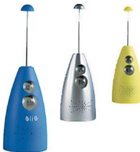
Nr kat. 1210a 1 510 pkt.

Wysoka jakość zdjęć to zasługa przetwornika Super HAD CCD 1/2,5" o efektywnej rozdzielczości 7,2 megapiksela. Aparat jest także wyposażony w obiektyw Sony z zoomem optycznym 3x odpowiadający uniwersalnemu zakresowi 35-105mm dla filmu małoobrazkowego