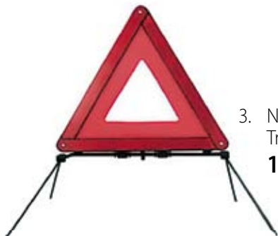
3. Nr kat. 1202 Trójkąt ostrzegawczy 1 000 pkt.