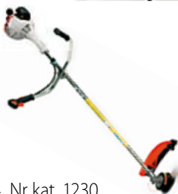
44. Nr kat. 1230 Kosa spalinowa Husqvarna 1,1 KM 40 000 pkt.

nasadki 1/2":10,-32mm. nasadki długie 1/2":14-19mm. nasadki do świec 1/2":16,21mm z wkładkami gumowanymi. nasadki 1/4":4,4-14mm. nasadki długie 1/4":6-13mm. nasadki 1/4" z bitami:Torx(T8,-30),Imbus(3- 6mm),PZ(1,2),PH(1,2),Płaskie(4,5,5,7mm). bity: Imbus(6-14mm),PH(3,4),Płaskie(8,10,12mm), PZ(3,4),Tox(T40,45,50,55). wkrętak 1/2" do nasadek i bitów. adapter do bitów 1/2". grze- chotki 1/2" i 1/4". przedłużki 1/2"(125,250mm) oraz 1/4"(50,100mm) a także przedłużka gięta 1/4"(150mm). przelotka 1/2". pokrętło typ T z kwadratem zabierającym 1/4". przeguby Car- dana 1/2" i 1/4". limbusy typ L(1.5,2,3mm).