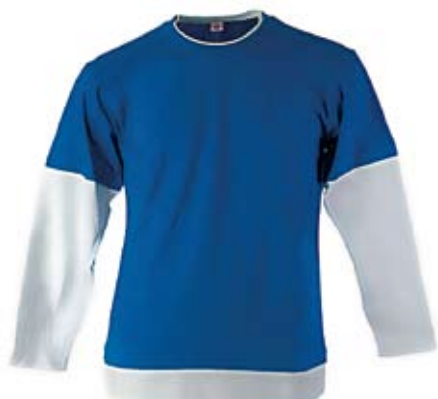
24. Nr kat. 1215 Bluza męska 2 400 pkt.