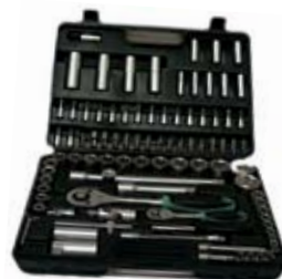
45. Nr kat. 1244 Komplet kluczy Einhell 8 500 pkt.