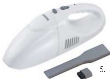
5. Nr kat. 1203 Odkurzacz samochodowy 3 000 pkt.