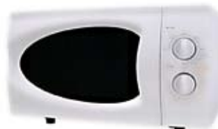
62. Nr kat. 1265 Mikrofalówka Zelmer 29ZO15 14 000 pkt.

Estetyczne i funkcjonalne urządzenia do mielenia wszelkiego rodzaju mięs, jarzyn, serów, maku. Specjalna nasadka dla smakoszy wędlin własnej roboty. Dodatkowa przystawka - szatkownica typ 86.4 pozwoli szybko poszatkować, pokroić i zetrzeć warzywa. Duża moc urządzenia pozwala na zmielenie do 1.2 kg produktów w ciągu jednej minuty. Gumowe nożyki antypoślizgowe zapewniają stabilną pracę urządzenia nawet podczas dużego nacisku.