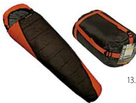
13. Nr kat. 1218 Śpiwór 5 000 pkt.