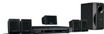
75. Nr kat. 1274 Kino domowe Panasonic SC-PT160 czarne 24 000 pkt.

SC-PT160 to zestaw kina domowego z możliwością odtwarzania płyt nagranych w formacie DVD-RAM, DVD-RW, DVD-R (DL), +RW, +R (DL), SVCD, CD, WMA, MP3, JPEG, MPEG4*, DivX wraz ze wsparciem dla polskich znaków. Posiada wbudowane złącze USB do odtwarzania plików MP3, WMA, JPEG oraz MPEG4. Dzięki zastosowaniu systemów Dolby Digital, Dolby ProLogic II i Digital Theatre System mamy gwarancję najwyższej jakości dźwięku.