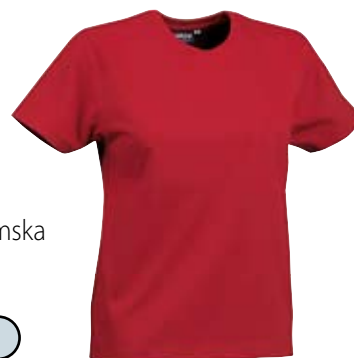
22. Nr kat. 1213 Koszulka damska 750 pkt.