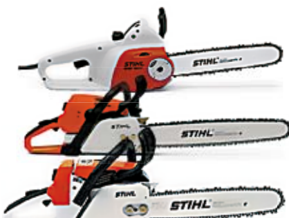
42. Nr kat. 1229 Pilarka łańcuchowa Stihl MS 170 38 500 pkt.