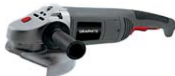
39. Nr kat. 1231 Szlifierka kątowna Graphite 59G061 600W 6 000 pkt.