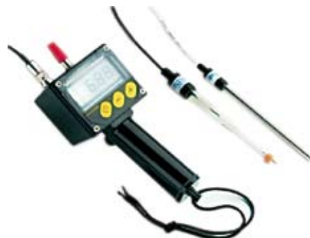
29. Nr kat. 1222 Dramiński tester kwasowości do gleby i płynów 36 300 pkt.