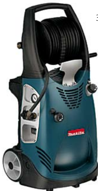
32. Nr kat. 1224 Myjka ciśnieniowa Makita 65 000 pkt.

Pompa trójstopniowa z łokiem osiowym, sterowana tarczą sterującą. Rolki transportowe dla łatwiejszego przemieszczania. Solidny silnik asynchroniczny. Zintegrowany uchwyt na wyposażenie. Filtr wodny, zabezpieczający przed uszkodzeniem pompy przez zanieczyszczenia. Głowica natryskowa umożliwiająca zmienny natrysk od strumienia wiązkowego do wielkopowierzchniowego. Wyposażona w dyszę Turbo-Rotopower i obrotową szczotkę. Wąż ciśnieniowy może w czasie pracy pozostawać na bębnie. Moc nominalna 2100 W. Maks. Ciśnienie 140 bar.