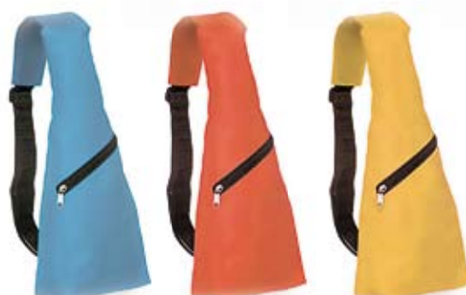
8. Nr kat. 1216 Plecak 887 pkt.