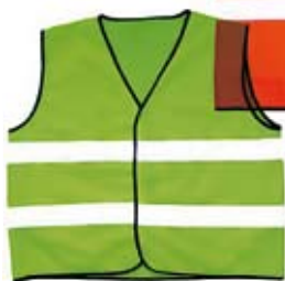
1. Nr kat. 1200 Kamizelka drogowa 750 pkt.