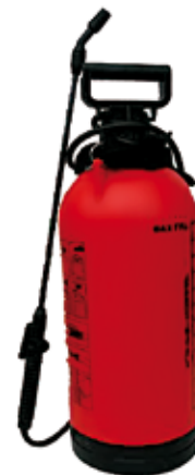
33. Nr kat. 1279 Opryskiwacz ciśnieniowy Pojemność zbiornika 7l 2 600 pkt.