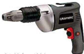
34. Nr kat. 1226 Wiertarka Graphite 600W 4 900 pkt.