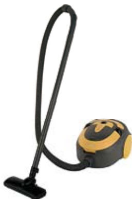
56. Nr kat. 1256 Odkurzacz ZELMER DUO typ 01D012 6 500 pkt.