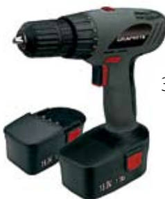
38. Nr kat. 1239 Graphite 18V 12 500 pkt.