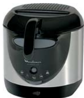
63. Nr kat. 1264 Frytkownica Moulinex akg 243 9 150 pkt.

Kuchenka mikrofalowa sterowana mechanicznie, o mocy mikrofal 800 W, pojemności 21 l. Posiada 5 poziomów mocy, grill kwarcowy oraz rożen.; Kolor: Biały; Sterowanie: Mechaniczne; Grill: Kwarcowy