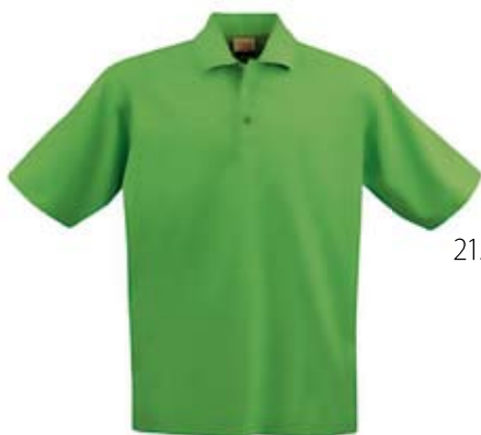
21. Nr kat. 1212 Koszulka POLO 1 700 pkt.