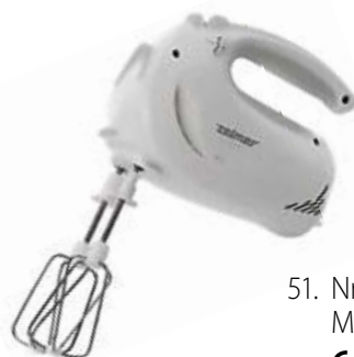
51. Nr kat. 1251 Mikser ZELMER Robi 6 600 pkt.