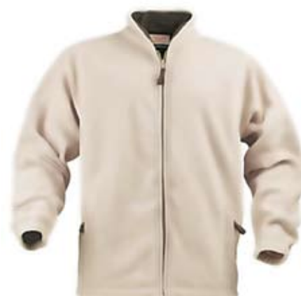
25. Nr kat. 1215 Kurtka polarowa 2 975 pkt.