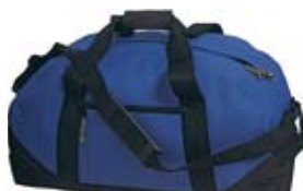
12. Nr kat. 1237 Torba 1 823 pkt.