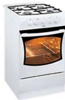
68. Nr kat. 1269 Kuchnia gazowa Amica 51ge1 42 500 pkt.

W eleganckiej, ponadczasowej formie kryje się przemyślana w najdrobniejszych szczegółach treść. Linia Practica to najlepsza propozycja dla szukających efektywnych i nowoczesnych rozwiązań ujętych w tradycyjne wzory. Modele tej linii świetnie dopasują się do wnętrza kuchni, a zaawansowana technologia pozwoli zaoszczędzić czas i pieniądze kuchnia gazowo-elektryczna, wolnostojąca, piekarnik elektryczny o mocy 2200 i pojemność 58 litrów Klasa energetyczna A