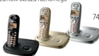
74. Nr kat. 1275 Telefon bezprzewodowy Panasonic KX-TG 7301 6 500 pkt.