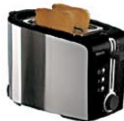
60. Nr kat. 1261 Toster Philips Hd 2626 11 500 pkt.

Zelmer Alexis Young typu 294.5 to krajalnica o oryginalnych kształtach, doskonałych funkcjach użytkowych i wysokiej sprawności. Świetnie dopasowana do dłoni pomaga w bezpiecznym i wygodnym posługiwaniu się urządzeniem. Urządzenie zostało wyposażone w zabezpieczenie przed przypadkowym uruchomieniem, a także przed przypadkowym wysunięciem wózka.