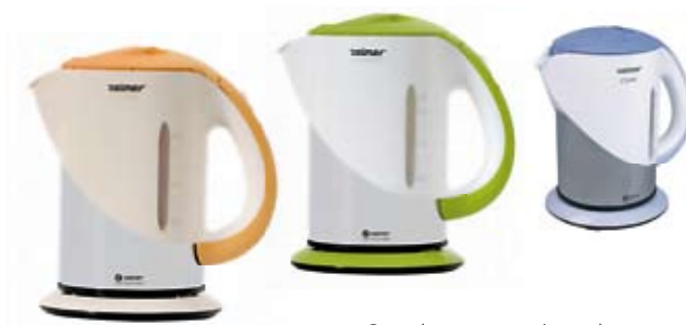
58. Nr kat. 1258 Zelmer CRYSTAL 332.2 4 000 pkt.

Czajnik o pojemności 1.7 litra wyposażony w płaską grzałkę umożliwiającą błyskawiczne zagotowanie wody. Pełne bezpieczeństwo użytkownika zapewnia m.in. automatyczny wyłącznik po zagotowaniu wody oraz zabezpieczenie przed włączeniem pustego czajnika. Moc 2000W