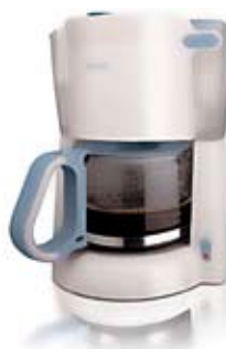
64. Nr kat. 1263 Ekspres do kawy PHILIPS HD 7448 4 500 pkt.

Frytkownica Moulinex AKG 243 Supralys posiada zewnętrzną, plastikową rączkę koszyka, system podnoszenia koszyka frytkownicy, Pokrywa z okienkiem, pojemność 1,2 kg świeżych frytek, 2,2 l oleju, regulowany termostat. Posiada przycisk włącznik/wyłącznik z lampką kontrolną. Moc 1900 W.