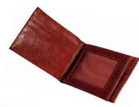
20. Nr kat. 1211 Portfel 735 pkt.