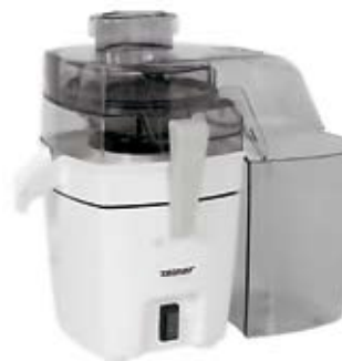
53. Nr kat. 1253 Sokowirówka Zelmer Jowita 10 400 pkt.