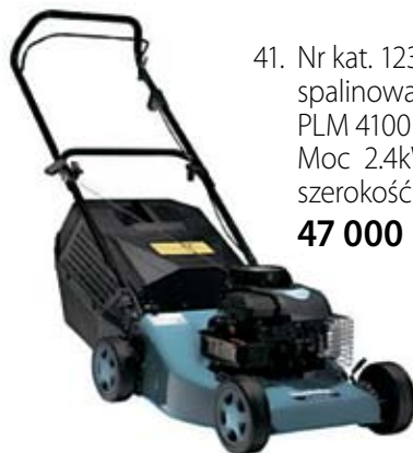
41. Nr kat. 1232 spalinowa Makita PLM 4100 Moc 2.4kW/3.5KM szerokość tnąca: 41cm 47 000 pkt.