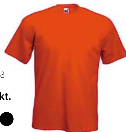
23. Nr kat. 1233 Koszulka 1 000 pkt.