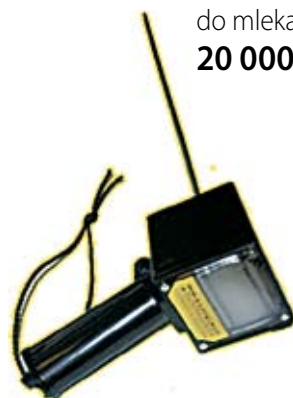
26. Nr kat. 1220 Dramiński termometr do mleka 20 000 pkt.

Pompa trójstopniowa z łokiem osiowym, sterowana tarczą sterującą. Rolki transportowe dla łatwiejszego przemieszczania. Solidny silnik asynchroniczny. Zintegrowany uchwyt na wyposażenie. Filtr wodny, zabezpieczający przed uszkodzeniem pompy przez zanieczyszczenia. Głowica natryskowa umożliwiająca zmienny natrysk od strumienia wiązkowego do wielkopowierzchniowego. Wyposażona w dyszę Turbo-Rotopower i obrotową szczotkę. Wąż ciśnieniowy może w czasie pracy pozostawać na bębnie. Moc nominalna 2100 W. Maks. Ciśnienie 140 bar.