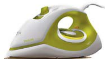
66. Nr kat. 1267 Philips gc1815 4 750 pkt.