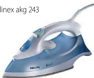
65. Nr kat. 1266 Żelazko Philips gc3106 7 350 pkt.