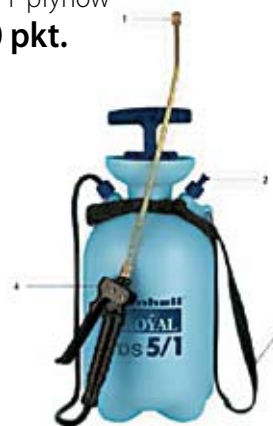
31. Nr kat. 1225 Opryskiwacz ciśnieniowy Einhell 5l 2 250 pkt.