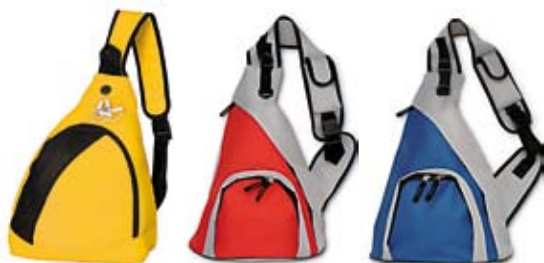
10. Nr kat. 1236 Plecak 1 525 pkt.