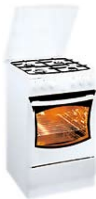
69. Nr kat. 1270 Kuchnia gazowa Amica 51ge3 75 800 pkt.

4 programy, temperatury zmyw. 35°C/50°C/65°C, 10 kpl. naczyń, klasy AAA, Hot Air Drying, Aqua Spray, elektroniczny wskaźnik braku soli i nabyłyszczacza, automatyka twardości wody, regulacja wysokości górnego kosza,