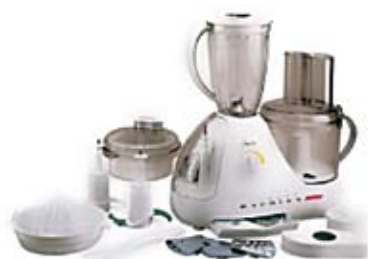
54. Nr kat. 1254 1254 Robot kuchenny MPM JULIA 116J 6 250 pkt.

Funkcje siekanie, mieszanie, rozdrabnianie, ucie- ranie, zagniatanie ciasta, miksowanie, ubijanie, krojenie w plastry, wyciskanie soku, możliwość jednoczesnej pracy blendera i malak- sery, pojemność malaksera 1,5L, po- jemność blendera 1L, 3 prędkości + funkcja „PULSE”, praktyczne schowki na akcesoria Wposażenie przystawka wirująca do soku, 5 tarcz ze stali nierdzewnej