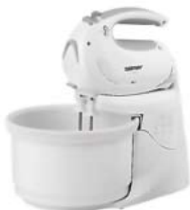
52. Nr kat. 1252 Mikser ZELMER Robi z miską 8 950 pkt.