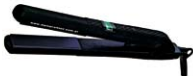
46. Nr kat. 1247 Prostownica mpm BWT-B54/C 2 500 pkt.