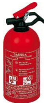
2. Nr kat. 1201 Gaśnica 1 750 pkt.