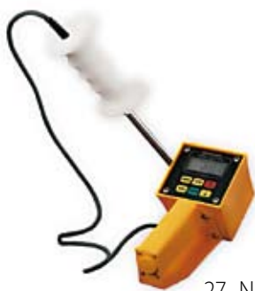
27. Nr kat. 1219 Dramiński tester wilgotności do siana i słomy sprasowanej 40 260 pkt.