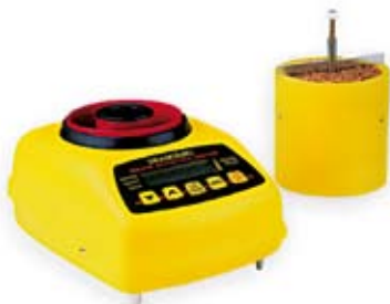
28. Nr kat. 1221 Dramiński miernik wilgotności ziarna 30 500 pkt.