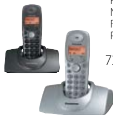
73. Nr kat. 1276 Telefon bezprzewodowy Panasonic KX-TG 1100 6 600 pkt.

Przekątna ekranu 32" Format obrazu 4:3, 14:9, 16:9 Rozdzielczość 1366 x 768 (WXGA) Standard HD HD Ready Kontrast dynamiczny 5000:1 Rodzaj tunera analogowy (naziemny) Obsługiwane standardy sygnału HDTV, NTSC, PAL, SECAM Telegazeta 200 stron Głośniki 2 x 10W Możliwość powieszenia na ścianie tak Złącza 2 x HDMI, RCA, 1 x S-video, 1 x SCART, słuchawkowe Cechy dodatkowe filtr grzebienny 3D, menu w języku polskim, Progressive Scan, Q-Link, redukcja szumów obrazu ruchomego