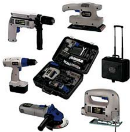
43. Nr kat. 1245 Zestaw narzędzi Einhell 15 750 pkt. Zestaw zawiera : Wkrętarka akumulatorowa LE-AS 14,4/1. Wydajność akumulatora: 14,4 V / 1,2 Ah Zakres uchwytu wiertarskiego: 1-10 mm Szlifierka oscylacyjna LE-SS 135 - Moc: 135 W Szlifierka kątowna LE-WS 115 - Moc: 500 W - Średnica tarczy: 115 mm