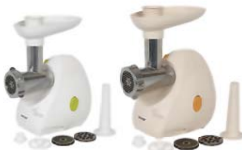
61. Nr kat. 1262 Maszynka do mielenia mięsa ZELMER DIANA 13 500 pkt.

Estetyczne i funkcjonalne urządzenia do mielenia wszelkiego rodzaju mięs, jarzyn, serów, maku. Specjalna nasadka dla smakoszy wędlin własnej roboty. Dodatkowa przystawka - szatkownica typ 86.4 pozwoli szybko poszatkować, pokroić i zetrzeć warzywa. Duża moc urządzenia pozwala na zmielenie do 1.2 kg produktów w ciągu jednej minuty. Gumowe nożyki antypoślizgowe zapewniają stabilną pracę urządzenia nawet podczas dużego nacisku.