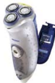
49. Nr kat. 1249 Maszynka do golenia Philips HQ7782 1 500 pkt.