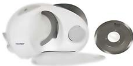
59. Nr kat. 1259 Krajalnica Zelmer Alexis Young 7 200 pkt.

Czajnik o pojemności 1.7 litra wyposażony w płaską grzałkę umożliwiającą błyskawiczne zagotowanie wody. Pełne bezpieczeństwo użytkownika zapewnia m.in. automatyczny wyłącznik po zagotowaniu wody oraz zabezpieczenie przed włączeniem pustego czajnika. Moc 2000W