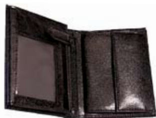
Nr kat. 1211a 755 pkt.