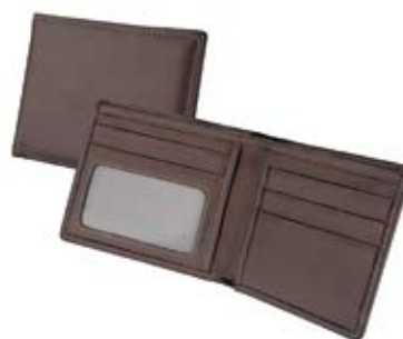
Nr kat. 1211b 1 950 pkt.