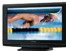
72. Nr kat. 1273 Telewizor 32 lcd 80 000 pkt.

Dane techniczne Pojemność: 5.5 kg Prędkość wirowania: 1200 obr./min Zużycie wody: 49.5 l Zużycie energii: 0.93 kWh Ilość programów prania: 15 programów Klasa energetyczna A plus Klasa skuteczności prania A Wysokość: 850 mm Szerokość: 596 mm Głębokość: 505 mm Kolor: Biały z aluminiowym oknem