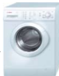
70. Nr kat. 1271 Pralka BOSH WAE 20160pl 55 000 pkt.

W eleganckiej, ponadczasowej formie kryje się przemyślana w najdrobniejszych szczegółach treść. Linia Practica to najlepsza propozycja dla szukających efektywnych i nowoczesnych rozwiązań ujętych w tradycyjne wzory. Modele tej linii świetnie dopasują się do wnętrza kuchni, a zaawansowana technologia pozwoli zaoszczędzić czas i pieniądze kuchnia gazowo-elektryczna, wolnostojąca, piekarnik elektryczny o mocy 2200 i pojemność 58 litrów Klasa energetyczna A